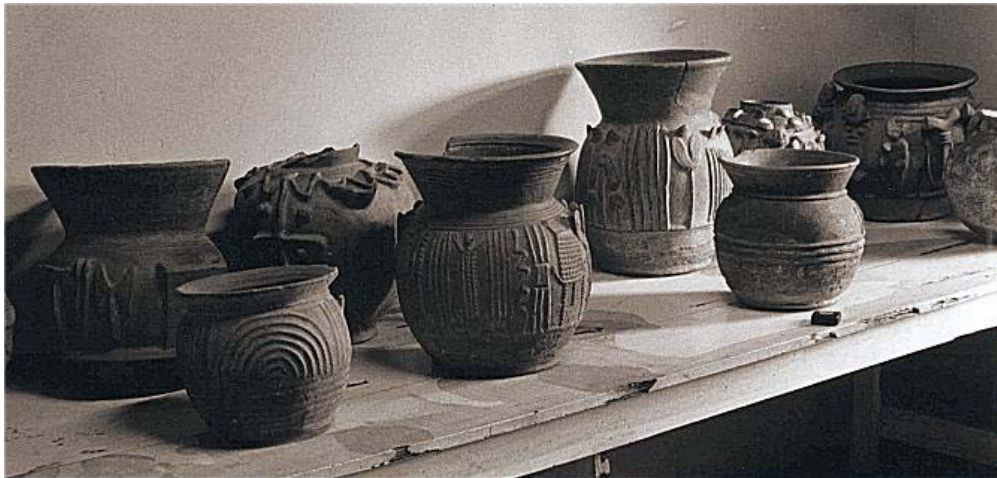
Shango Ritual Vessels. Earthenware. Ita Yemoo Museum of Yoruba Pottery, Ile Ife, Nigeria.

Para los Yoruba el arte y la religión jamás han estado separados. La cerámica yoruba era un arte con el cual se adoraban a las diferentes deidades, y con estas obras de arte, adornaban sus tronos y receptáculos. Decir que el colocar hermosas soperas labradas y trabajadas es un “invento” cubano, está bastante alejado de la realidad, ya que podemos observar diferentes piezas de “ soperas ” de Changó, como las que se muestran en el Museo Yemoo de Cerámica Yoruba en Ile Ifé . Los ceramistas yoruba, hace mucho tiempo se han dedicado a crear una amplia gama de únicas y muchas veces asombrosas piezas, que varían en las esferas tanto domésticas como rituales. Hechas de terracota y cocinadas abiertamente, las cerámicas yoruba son extremadamente funcionales.